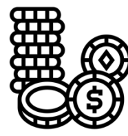
Preise für den Lottoabend CHF 50