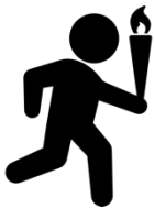
Fackelwanderung durchs Saas CHF 100