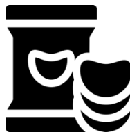
«Zwipf» in der Gondel CHF 40