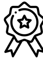
Medaillen für das Rennen CHF 175