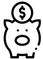
Oder freie Beiträge nach Wahl...