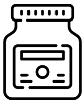
Nutella zum z'Morge CHF 20

Wir freuen uns auf Ihre Unterstützung und danken Ihnen herzlich dafür! Ihr Beitrag ermöglicht es, das Schneesportlager weiterhin preiswert anzubieten. Wir haben dazu verschiedene Angebote zusammengestellt.