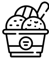
Dessert zur Krönung des Tages CHF 125