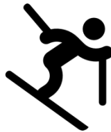
Ski- & Snowboardrennen CHF 150